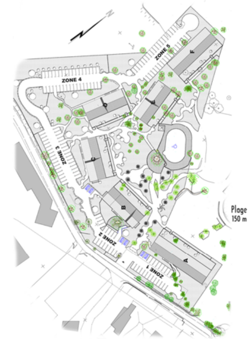
Plan de localisation des bâtiments