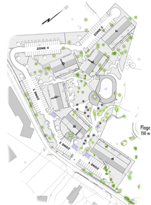
Plan de localisation des bâtiments